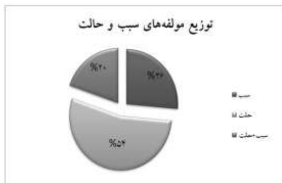
شکل (۳) توزیع مؤلفه‌های سبب و حالت

در مفهوم‌سازی افعال حرکتی بسیط زبان فارسی نقش دارند و مؤلفه «شیوه» از بسامد وقوع بیشتری برخوردار است.