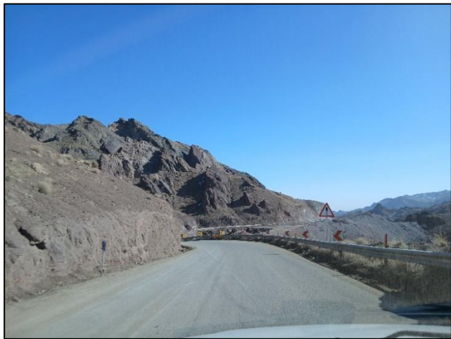
شکل ۲. قوس افقی با دید ناکافی

توقف برای تمامی مقاطع مورد ارزیابی محقق گردید، فرآیند در دور دوم متوقف شده و پایایی ابزار نظرسنجی تایید شد.